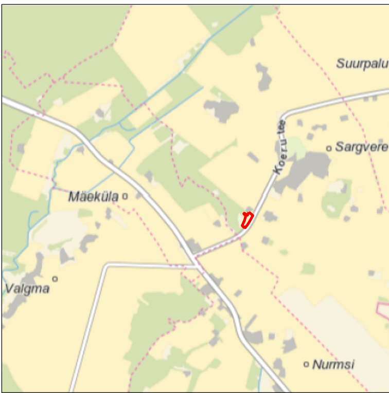
Kaardilehed nr 6324 Paide ja 6413 Järva-Jaani

Š-6 69,71 0,5 67,91 1,3 66,41 1,5 KA-1 66,84 0,2 66,41 0,4 VA-6 0,9 TL (Kr 10,2; ST 30,9)